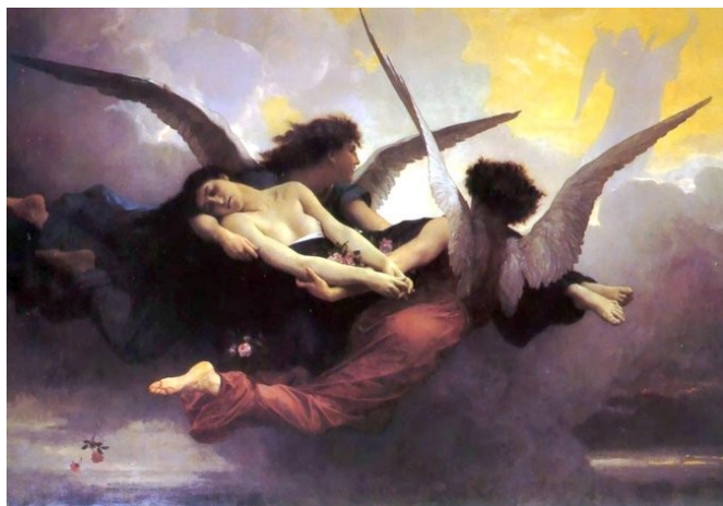
William-Adolphe Bouguereau Âme apportée au paradis